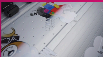
Szybkość druku - nawet do 32 m 2 /h przy zachowaniu najwyższej jakości