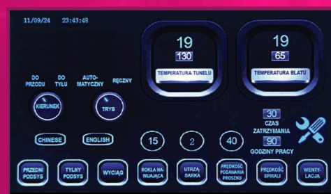
Powder Shaker z polskim menu