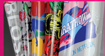
Wysokiej jakości folia PET do ściągania na zimno i gorąco.