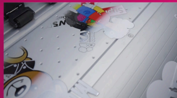
Szybkość druku - nawet do 32 m 2 /h przy zachowaniu najwyższej jakości