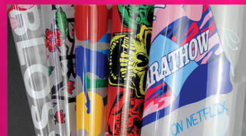
Wysokiej jakości folia PET do ściągania na zimno i gorąco.